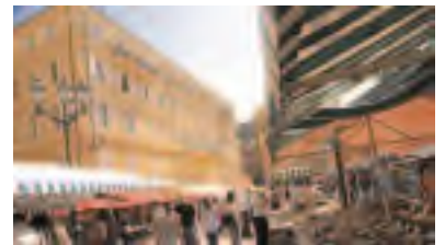
Le marché du cours Saleya

Todos los días, excepto los lunes, de las 6.00 a las 13.00