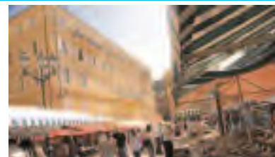
Il mercato del cours Saleya

Mercato ittico Tutti i giorni, tranne il lunedì, dalle 06.00 alle 13.00.